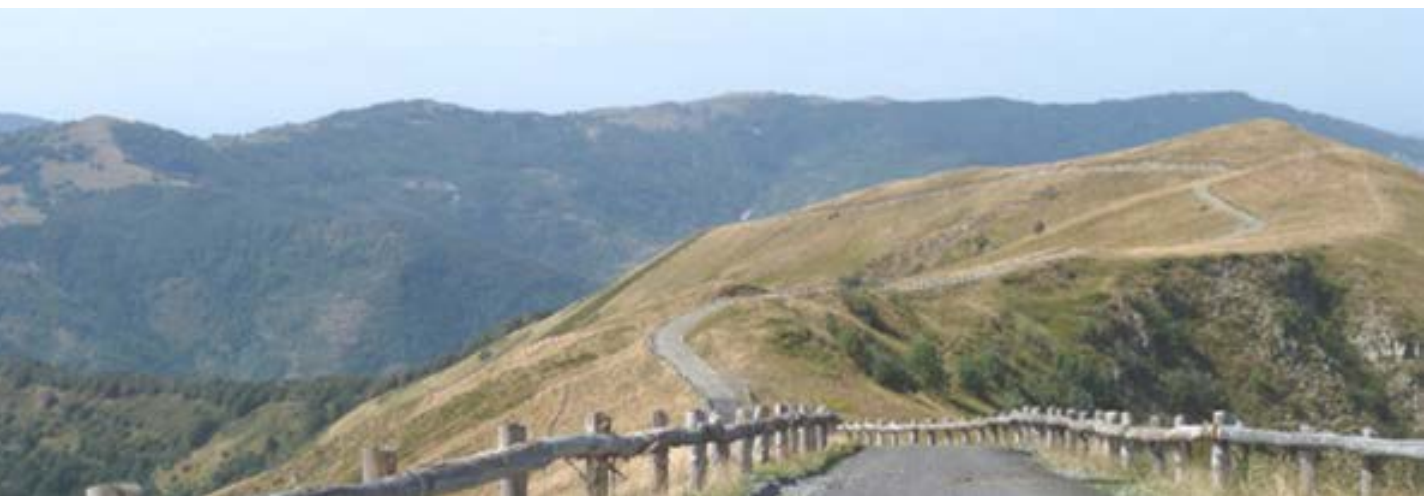
La foto di copertina è tratta dal sito internet della provincia di Pavia relativamente al SIC Le Torraie Monte Lesima